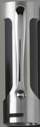
Stilografica Fountain Pen